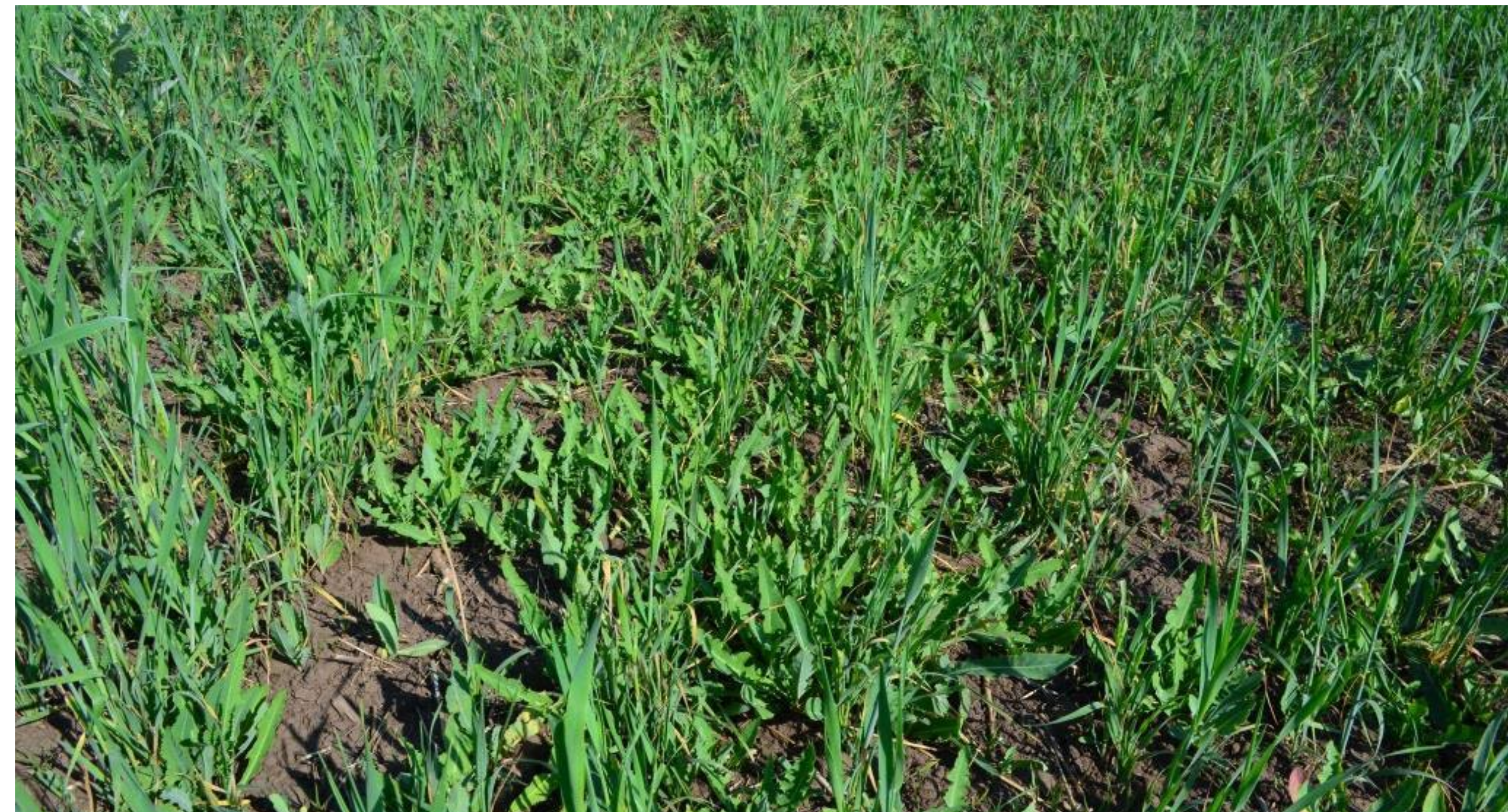
Контроль без обработки