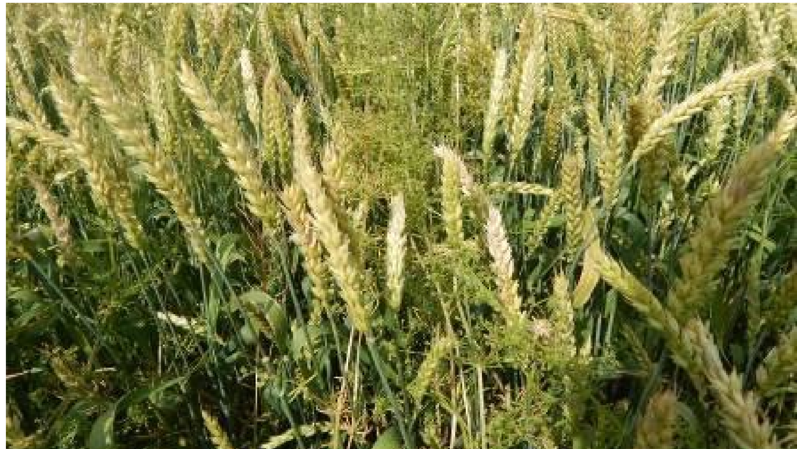
Контроль без обработки