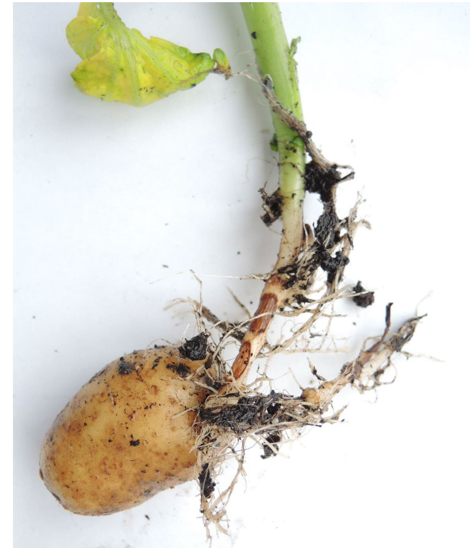
Контроль без обработки