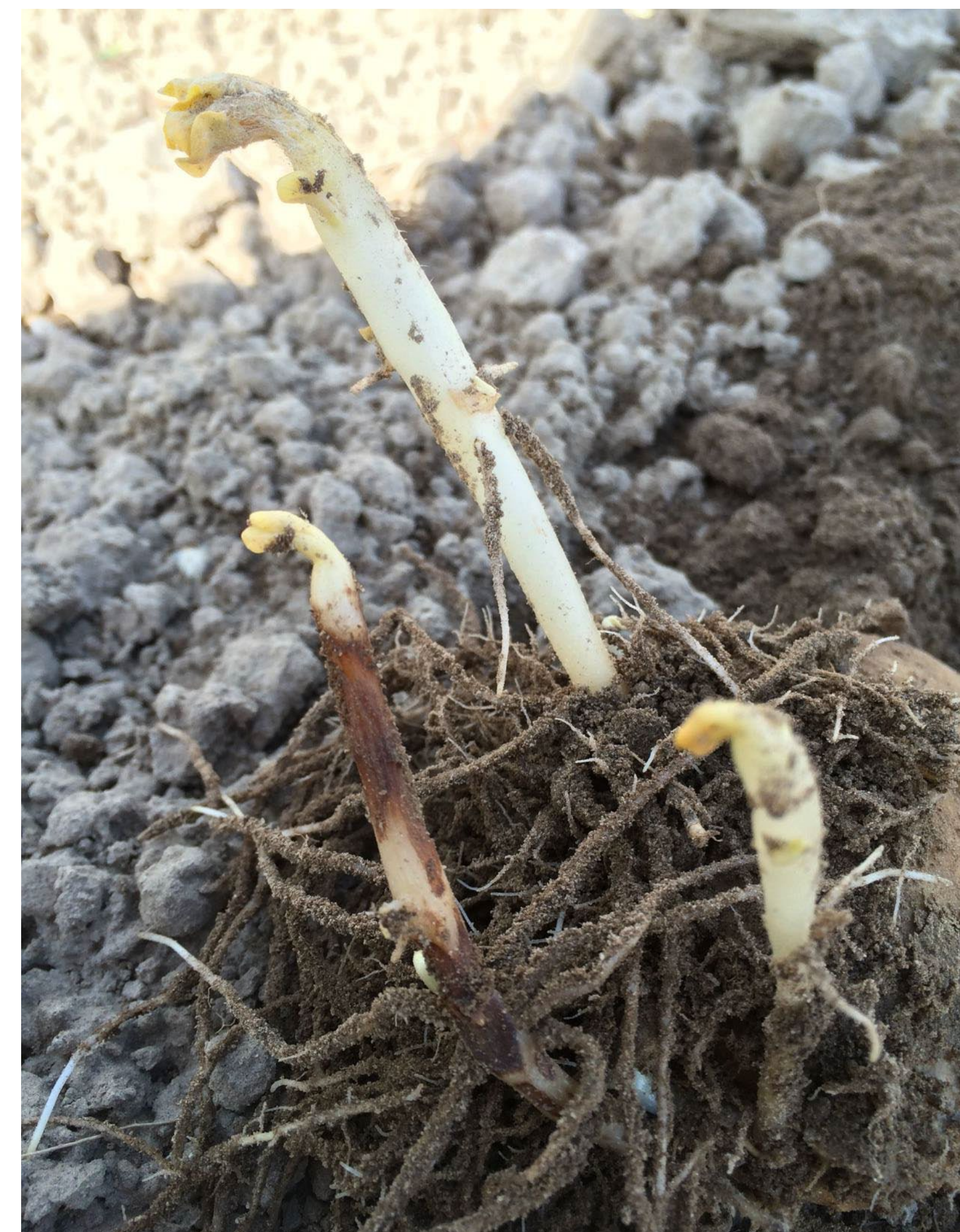
Контроль без обработки